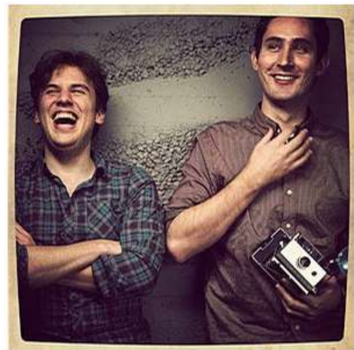
Mike Krieger و Kevin Systrom

عکس‌های آیفون همواره خوب به نظر نمی‌رسد. Kevin Systrom، کارمند پیشین گوگل، و Mike Krieger، که پیش‌تر کار در مایکروسافت را تجربه کرده بود، Instagram را ایجاد کرده و برنامه‌ای ساختند تا با آن کاربران بتوانند به عکس‌های خود افکت‌های گوناگون افزوده و در شبکه‌های اجتماعی مختلف به اشتراک گذارند.